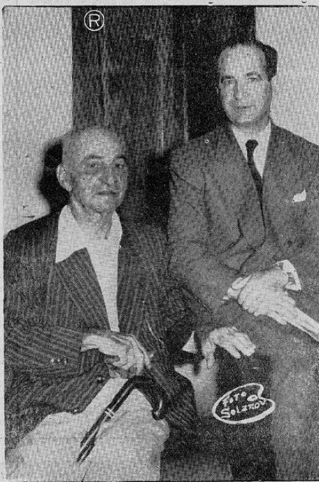
Ultima fotografia tomada en la Casa Presidencial en el recién pasado mes de enero cuando visitó al Sr. Presidente de la República

Muchas, muchísimas fueron las actuaciones nobles que le conocimos, nosotras que por feliz inspiración escribimos, tres me-